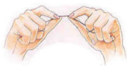
Illustratie: Braun Oral-B