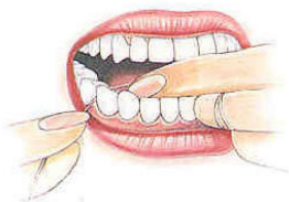
Illustratie: Braun Oral-B